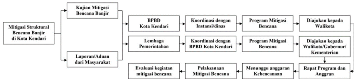
Gambar 3. Alur pelaksanaan mitigasi struktural bencana banjir di Kota Kendari (Hasil Analisis Data Primer, 2021)

di suatu kawasan rawan banjir berdasarkan tugas dan perannya masing-masing atau telah menerima laporan/aduan dari masyarakat terkait pengadaan infrastruktur, serta sarana dan prasarana penanggulangan bencana banjir di Kota Kendari. Kajian dan laporan yang mampu dilakukan oleh BPBD Kota Kendari, akan masuk sebagai program penanggulangan bencana banjir Kota Kendari dan mulai dilaksanakan setelah BPBD Kota Kendari menerima anggaran penanggulangan bencana yang berasal dari APBD atau APBN. Adapun mitigasi struktural yang tidak dapat dilaksanakan oleh BPBD Kota Kendari, akan diberikan kepada lembaga pemerintahan lainnya yang memiliki kemampuan, anggaran, dan sumber daya. Berikut mekanisme pelaksanaan mitigasi struktural bencana banjir di Kota Kendari dapat dilihat pada Gambar 3 berikut.