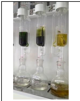
Gambar 3. Ekstraksi Metode Sokletasi

Terakhir, sokletasi dengan metanol 96% menunjukkan hasil yang cukup baik dalam ekstraksi yaitu 0,8% (m/v).