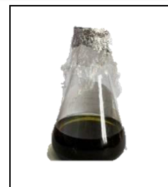
Gambar 2. Ekstraksi Metode Ultrasonik

Berdasarkan hasil penelitian yang disajikan pada table 1, metode Ultrasonic Assisted Extraction menunjukkan hasil tertinggi dengan konsentrasi 2,4% (m/v), diikuti oleh metode sokletasi dengan konsentrasi 0,8% (m/v). Metode ekstraksi UAE memanfaatkan bantuan gelombang ultrasonik dengan frekuensi antara 20 kHz hingga 2000 kHz (Triyastuti & Djaeni, 2019). Tingginya konsentrasi yang dihasilkan oleh UAE disebabkan oleh minimnya degradasi senyawa bioaktif karena proses ekstraksi dengan metode UAE dilakukan pada suhu yang lebih rendah sehingga stabilitas senyawa dari daun kelor dapat dipertahankan dan diperoleh kualitas yang lebih baik. Selain itu, pemilihan pelarut dan suhu dalam ekstraksi senyawa bioaktif dari daun kelor sangat mempengaruhi hasil ekstraksi.