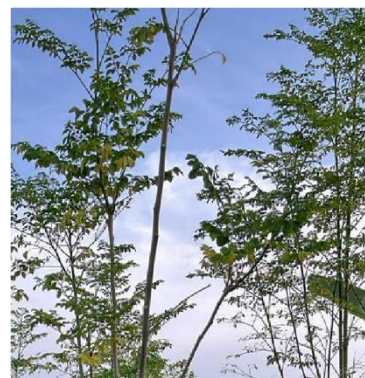
Gambar 1. Daun Kelor ( Moringa oleifera )

Tanaman kelor merupakan salah satu tanaman yang paling bermanfaat di dunia. Tanaman Kelor memiliki banyak nutrisi karena mengandung berbagai macam senyawa fitokimia pada daunnya, polong, dan biji. Kelor ( Moringa oleifera ) sebagai antimikroba menunjukkan adanya senyawa antimikroba yang terdiri dari alkaloid, flavonoid, saponin, dan tanin yang merupakan senyawa bioaktif berfungsi sebagai antimikroba (Ulfa Hamrat & Narwastu Dwi Rita, 2023). Gambar 1 menunjukkan morfologi daun kelor ( Moringa oleifera ), yang digunakan sebagai bahan utama pembuatan simplisia pada penelitian ini. Daun tersebut dipilih dalam kondisi segar dan sehat untuk memastikan mutu simplisia yang dihasilkan tetap optimal.