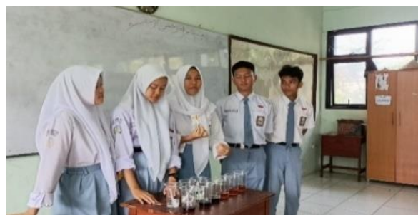
Gambar 2 Kelompok Gaya Belajar Kinestetik Presentasi dengan Melakukan Praktikum

diminta untuk merencanakan dan menyiapkan hasil diskusi dalam bentuk presentasi. Kemudian peneliti mengarahkan untuk melakukan diskusi kelas dan memberikan kesempatan kepada kelompok lain untuk bertanya atau menanggapi. Peserta didik dengan gaya belajar visual menyajikan hasil dengan membuat infografis dan power point, kelompok gaya belajar auditori dengan menjelaskan secara langsung menggunakan papan tulis, sedangkan kelompok gaya belajar kinestetik melakukan praktikum langsung di depan kelas.