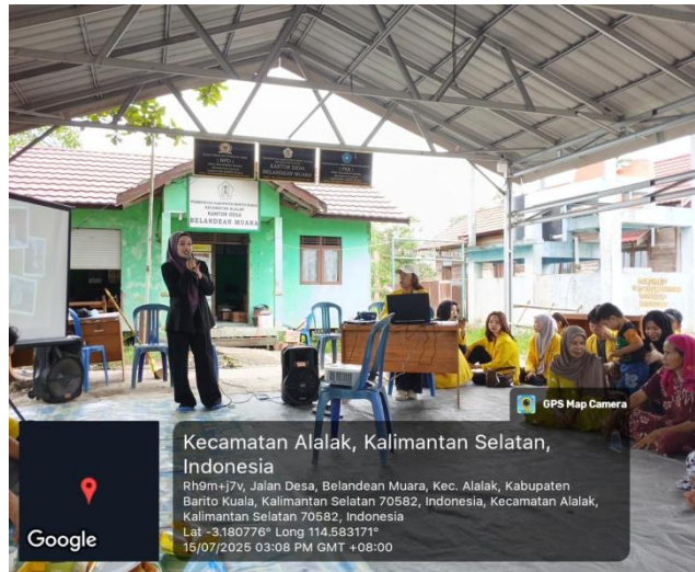
Gambar 2. Proses Kegiatan Sosialisasi kepada Masyarakat

Desa Balandean Muara. Temuan ini sejalan dengan konsep community-based tourism (CBT) sebagaimana dikemukakan oleh Suansri (2003), yang menekankan keterlibatan aktif masyarakat dalam setiap tahapan pengembangan pariwisata.