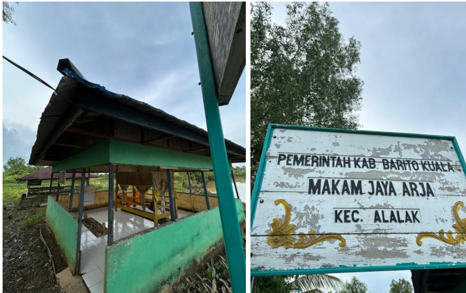
Gambar 3. Makam Panglima Jaya Arja

juga didukung dengan perbaikan fasilitas sederhana, seperti penataan titik wisata dan penambahan penanda lokasi, sehingga memudahkan akses wisatawan dan memperkuat citra destinasi.